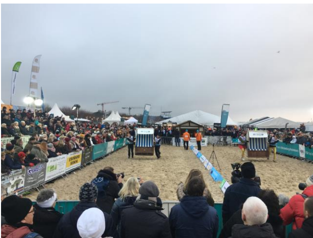
Winterstrandkorbfest mit Strandkorb WM 2020

"Die Veranstalter der Strandkorb WM sind sich ihrer Verantwortung bewusst, dass ein Großevent wie die Strandkorb WM auch unter Einhaltung aller möglichen Sicherheitsvorkehrungen und Abstandsregeln in diesem Winter nicht stattfinden kann. Auch wenn Sport und Spaß bei unserem Event im Vordergrund stehen, haben Gesundheit und das Wohlergehen unserer Sportler, Gäste und Partner dabei selbstverständlich und zu jeder Zeit höchste Priorität. Wir freuen uns auf ein Wiedersehen am 21. und 22. Januar 2022 wenn es wieder heißen wird 'An die Körbe - Fertig - Los'. ", so die wsf-Veranstaltungsagentur.